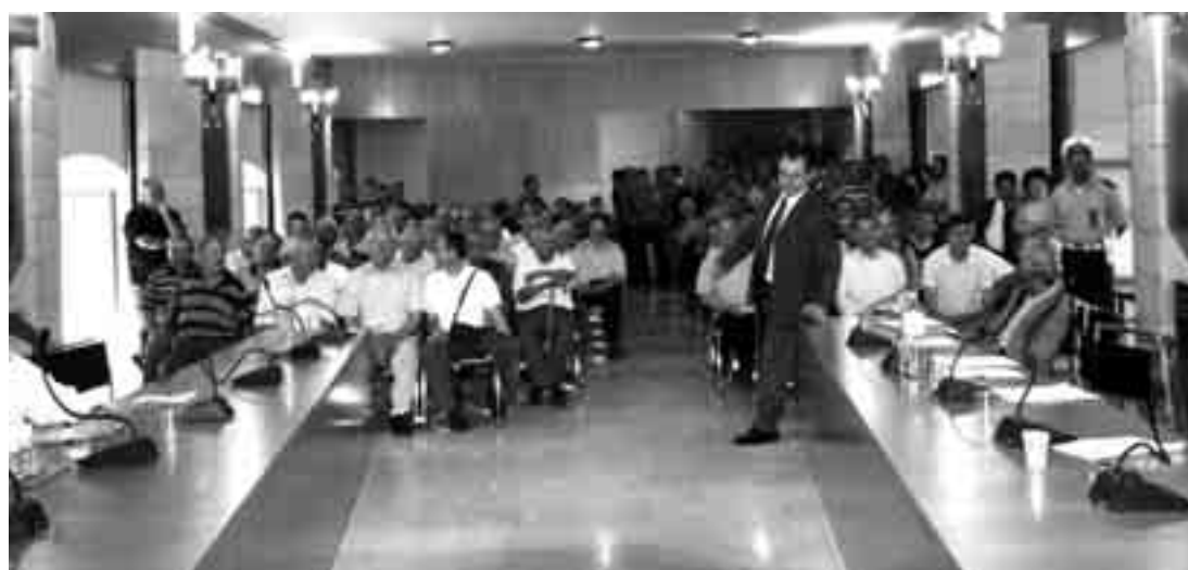
A sinistra un'affollata seduta del Consiglio comunale palnese cui hanno preso parte decine di cittadini interessati alle decisioni amministrative

PALMA DI MONTECHIARO Maggioranza di centrosinistra in difficoltà in Consiglio dove l'opposizione è riuscita a imporre i propri emendamenti