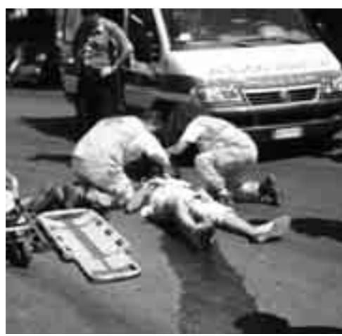
FERITO SOCCORSO DAL PERSONALE DELL'AMBULANZA

Ravanusa. L'incidente si è verificato martedì sera all'ingresso della via Olimpica