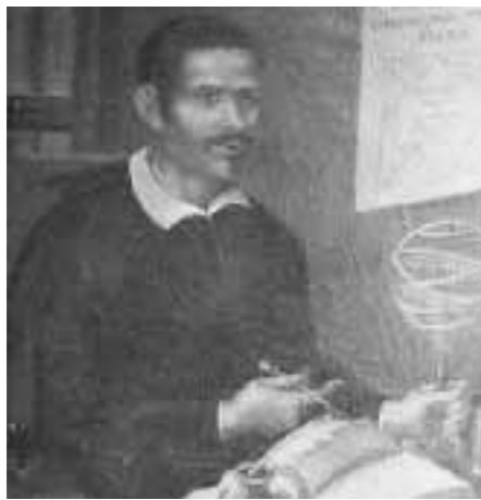
RITRATTO DI GIOVAN BATTISTA ODIERNA

PALMA DI MONTECHIARO. Scoperto, sulla lapide che lo ricorda, un madornale errore riguardante la data della sua morte