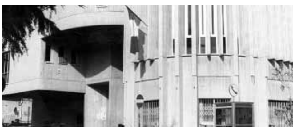
NELLA FOTO, IL PALAZZO COMUNALE DI RAVANUSA