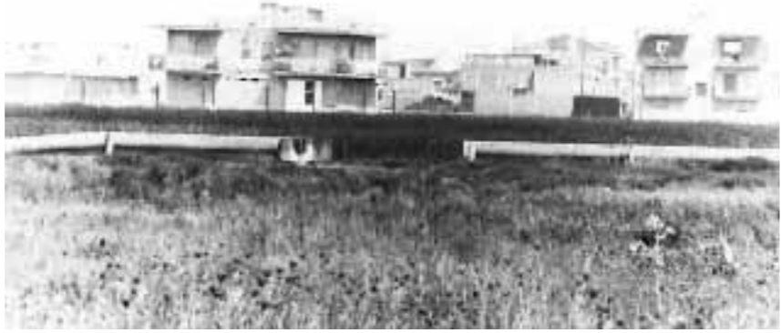
A PALMA DI MONTECHIARO IL FENOMENO DELL'ABUSIVISMO EDILIZIO SEMBRA INARRESTABILE