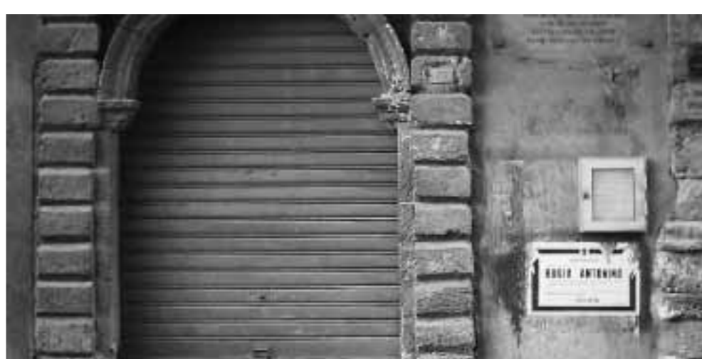
Il portone d'ingresso della casa di via Turati dove visse il primo arciprete palmeso